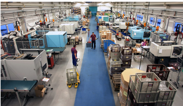
Abb. 1: Blick in eine Kunststoffteilefertigung

Vielen kleine und mittlere Unternehmen betreiben Maschinen als Insel-Lösung. Die Übersicht untereinander, die Auslastungen sowie eine Übersicht zu Restlaufzeiten sind meist nicht vorhanden. Somit ist eine transparente Produktion als Grundlage für eine bedarfsge-richte Produktionssteuerung nicht gegeben.